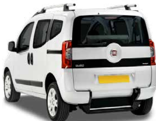
LA VISIBILITA' POSTERIORE E' MANTENUTA!

Rampa di accesso: in alluminio antiscivolo, Misure 1125 x 725 mm