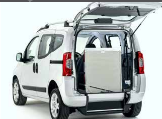
IL VEICOLO ABBASSATO RENDE UN ACCESSO FACILE, VELOCE E PROTETTO DALLE INTEMPERIE